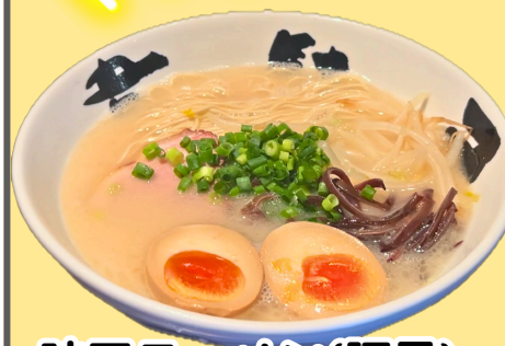
味玉ラーメン(豚骨)

ラーメンウォーカーにも10年掲載。全てに手間をかけた20時間をかけて作られる一切臭みのない豚骨ラーメン。豚の部位にもこだわっている。岩手産味玉、シンプルな見た目は味にこだわりがあるから。極細麺とコク旨スープが見事に調和。熱いスープの香りが漂い、心も体もほっとします。季節限定メニューなどもあり好奇心を満たしてくれる。また店名の由来は店主の料理捌き、ラーメン作りが秀逸で早いということから韋駄天になったそう。